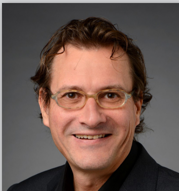
Michael Harth www.harth.ch

Bei vielen anspruchsvollen Vorhaben sind wir dankbar, wenn sich zusätzlich das Quäntchen Glück einstellt, um erfolgreich zu sein. Glück haben und glücklich sein sind 2 Themen, die stark miteinander verbunden sind. Nach einigen anfänglichen Hemmungen, hat sich die Glücksforschung in der Wissenschaft etabliert und jährlich werden neue Forschungsergebnisse veröffentlicht. Mit einer optimierten Einstellung und einem strategischen Vorgehen kann so dem Glück im (Berufs- und Führungs-)Alltag auf die Sprünge geholfen werden. So können sich erste Erfolge kurzfristig ergeben, positive Veränderungen sind vor allem mittelfristig sichtbar.